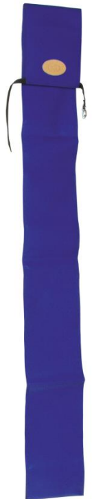
Suojapussi DFO 117