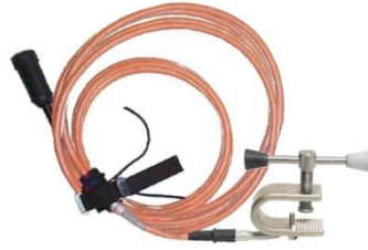
1-vaiheinen maadoituslaite JK238-DXF Sopii käytettäväksi maadoitusjohtimena. Käytetään teräsrakenteissa, joiden materiaali-paksuus on enintään 30 mm.