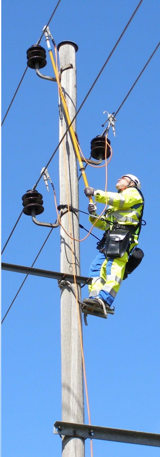
3-vaiheinen maadoituslaite JSKL3-SQL pikalukitusliittimellä Käyttöjännite 0,4 – 52 kV enintään 16,0 kA/1s