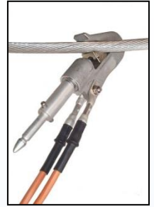
Liitin voidaan myös asettaa vinottain kohti johdinta