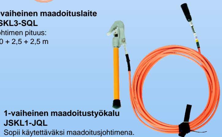
1-vaiheinen maadoitustyökalu JSKL1-JQL Sopii käytettäväksi maadoitusjohtimena. Johdinpituus: 15 m Sauvan pituus: 0,3 m