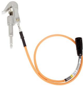
1-vaiheinen maadoituslaite JSKL1-SQL Johtimen pituus 1,5 m

Käyttöjännite 0,4 - 52 kV. Maadoituslaite tyyppin JSKL liittimellä on kehitetty sellaiseksi, että se voidaan nopeasti ja helposti liittää avojohtoihin (halkaisija 1 - 25 mm, Cu 10 mm 2 - FeAl 329 mm 2 ). Liitin voidaan liittää vinottain johdinta vasten, mikä helpottaa asennusta merkittävästi. Johdinliittimessä (JSKL-SQL) on pikalukitus toiminto , jossa liittimen kiristys tehdään vain yhdellä kierroksella. Linjajohdinlaitteesta on saatavana myös trapetsikierteinen johtoliitin. Tällöin tyyppimerkintä on JSKL3-STG