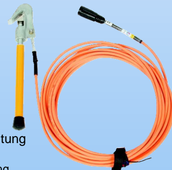
1-phasige Erdungsvorrichtung JSKL1-JTG Empfohlen als Erdungsleitung bei Arbeiten ohne Null-Leiter Länge Kabel: 15 m Länge Stange: 0,3 m