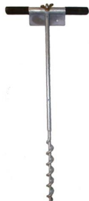
Erd - Bohrstange DJS 1 Für kurzzeitiges Erden