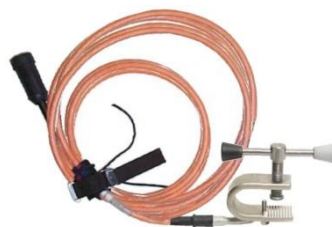
1-phasige Erdungsvorrichtung JK238-DXF Geeignet für Erdungen ohne Null-Leiter und Verbindungen an Konstruktionen bis 30 mm Stärke.