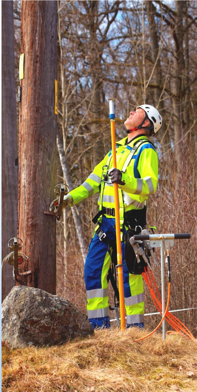
3-phasige Erdungsvorrichtung JSKL3-STG Nennspannung 0,4 – 52 kV max 16,0 kA/1s