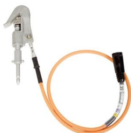
1-phasige Erdungsvorrichtung JSKL1-STG Leitungslänge: 1,5 m

Die Leitungsklemme JSKL-STG ist mit einem Trapez-Einschraubgewinde versehen, welches eine Befestigung mit nur einigen wenigen Umdrehungen ermöglicht. Unsere Leitungsklemme JSKL-SQL verfügt über eine Schnellver-schluß-Funktion, die den festen Sitz mit nur einer einzigen Bewegung garantiert.