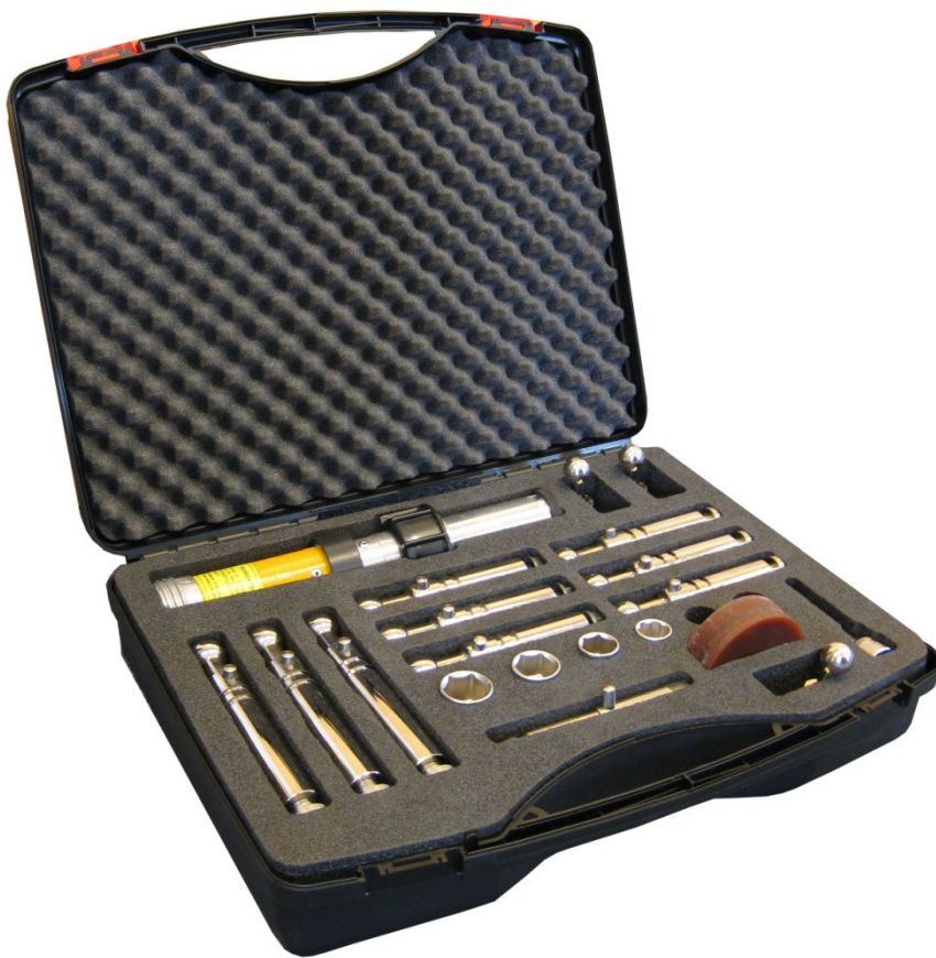
Verkygsväska SKA 630 II