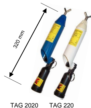
TAG 2020 TAG 220

Vid användning i trånga utrymmen, kapslade ställverk och i transversalmonterade ställverk, där det elektriska fältet kan ha så liten intensitet att risk för utebliven funktion finns, ska förlängningselektrod SXE 400 (se nedan) användas.