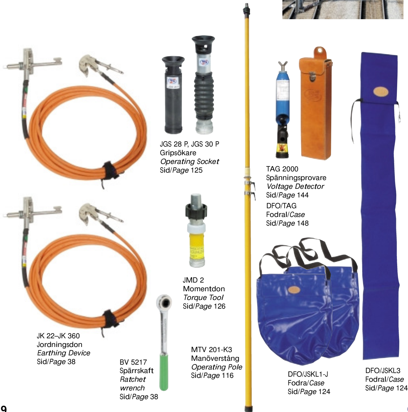
JK 22-JK 360 Jordningsdon Earthing Device Sid/Page 38