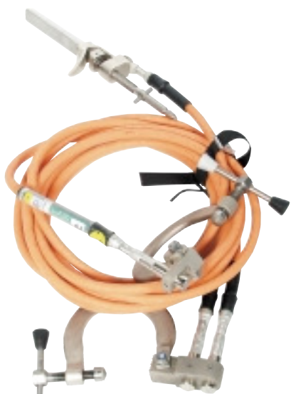
JSBL Jordningsdon Earthing Device Sid/Page 37