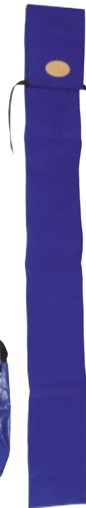
DFO Fodral/Case Sid/Page 124