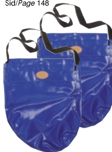
DFO/JSKL1-J Fodral/Case Sid/Page 124