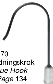
RK 170 Räddningskrok Rescue Hook Sid/Page 134